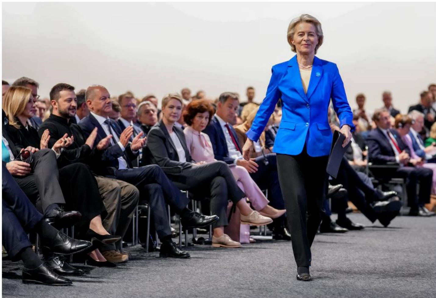
Ursula von der Leyen gisteren in Berlijn. Zij heeft nu de delicate opdracht om een meerderheid van Europarlementsleden voor zich te winnen.